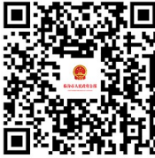
临汾市人民政府公报

主管主办单位:临汾市人民政府办公室 编辑印发单位:临汾市政府公报编辑中心 地址:临汾市解放西路市府街 电话:(0357)2091150